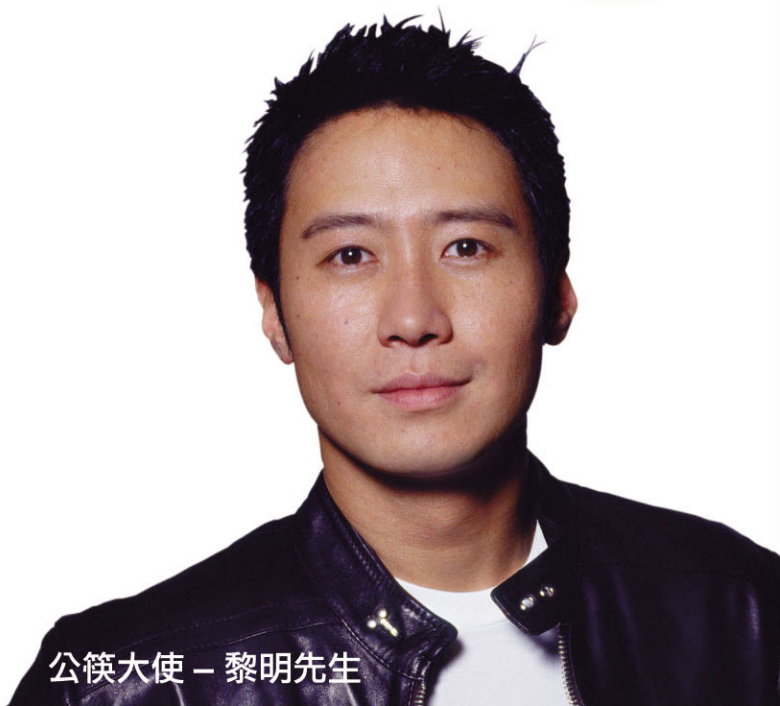
公筷大使 – 黎明先生